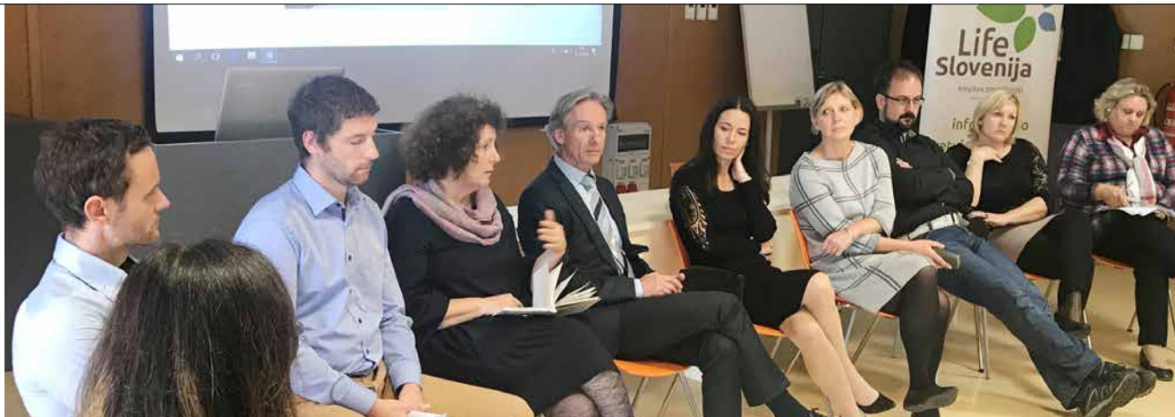
Udeleženci okrogle mize

Urbani forum je potekal v duhu povezovanja in dialoga različnih akterjev na področju urejanja zelenih površin v mestih: mestne/občinske uprave, nevladnih organizacij, predstavnikov stroke, trga in prebivalcev. Udeleženci so se strinjali, da se slovenske občine v večini zavedajo pomena zelenih površin za kvaliteto življenja v občini in jih zato aktivno razvijajo v sklopu različnih projektov.