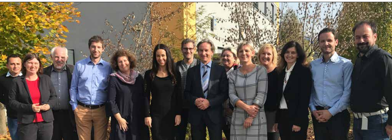
Sodelujoči na okrogli mizi

Občinski predstavniki so v debati izkazali razumevanje potrebe po sodelovanju s strokovnjaki na področju zelene ureditve - večina občin ima tako za urejanje zelenih površin posebno hortikulturno komisijo, v kateri so poleg občinskih predstavnikov tudi predstavniki javne komunale, gozdarji, hortikulturisti in drugi.